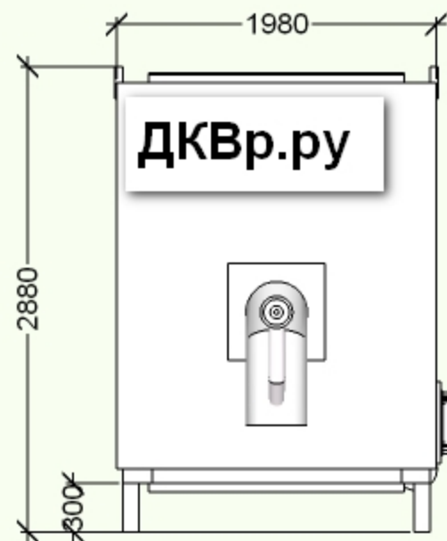
Котел водогрейный КВа-3,5: